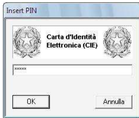
Figura 3: Inserimento PIN