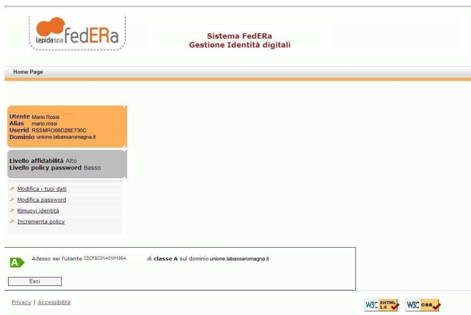
Illustrazione 5: Fine registrazione

La registrazione è conclusa, la sua identità digitale è definita.