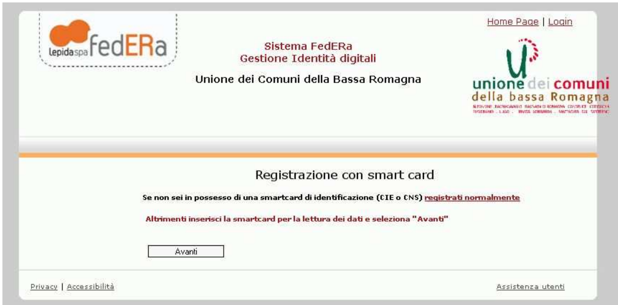
Figura 1: Avvio registrazione

Il link https://federa.lepida.it/idm/read-smart-card.htm?domain=unione.labassaromagna.it propone la pagina: